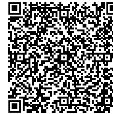
QR-Code kantonale Grundlagen